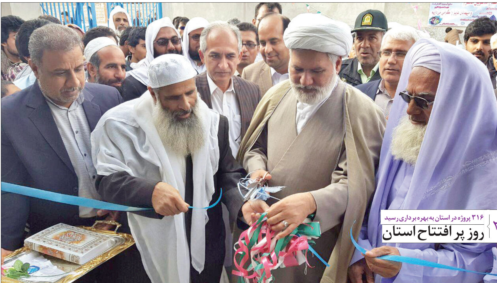
۳۱۶ پروژه در استان به بهره برداری رسید روز پر افتتاح استان