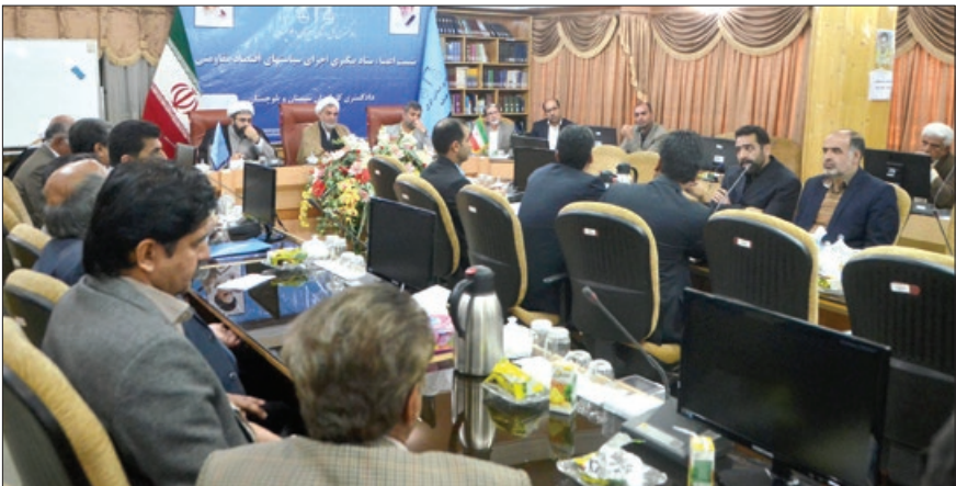
موضوع دام های زنده بومی و غیر بومی در استان به یک معضل تبدیل شده است

رئیس کل دادگستری استان هم گفت: عمده ترین مشکلات تولید کنندگان با بانک ها به ویژه بانک کشاورزی و صنعت و معدن درباره پرداخت تسهیلات دریافتی است که به منظور بررسی بیشتر به سازمان بازرسی استان ماموریت داده شد با ورود به موضوع های مطرح شده، عملکرد بانک ها به ویژه بانک کشاورزی در سال های اخیر بررسی و نحوه پرداخت و مشکلاتی را که تولید کنندگان با آن روبه رو هستند مورد ارزیابی قرار دهند. حجت الاسلام و المسلمین «ابراهیم حمیدی» افزود: در جلسه بعد این ستاد برای رفع مشکل تولید کنندگان استان و بانک های عامل پس از شنیدن گزارش سازمان بازرسی استان تصمیم گیری می شود، زیرا شفافیت و حقانیت موضوع های مطرح شده از سوی نمایندگان تولید کننده و بانک کشاورزی بر اعضای این ستاد برای تصمیم گیری بهتر و واحد مشخص نیست. وی اضافه کرد: باید تصمیم درستی برای رفع مشکلات تولید کنندگان و بانک ها گرفته و از متضرر شدن آن ها بر اساس قانون جلوگیری شود به طوری که هم بانک ها در زمان تعیین شده اقدام به جمع آوری معوقات خود کنند و هم تولید کنندگان مورد حمایت قرار گیرند و مشکلات آن ها در حوزه تولید رفع شود. وی تصریح کرد: موضوع