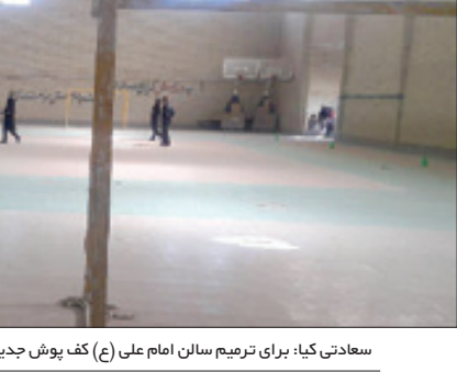
سعادت کیا؛ برای ترمیم سالن امام علی (ع) کف پوش جدید خریداری و مقرر شد پیمانکار جدید برای مونژ ایک کردن سالن انتخاب شود

دلایلی برای ساخت کف سالن از سیمان تگری استفاده کرد و به دلیل مناسب نبودن آن به مرور زمان کف پوش ها جدا شد و سالن از وضعیت مطلوب خود خارج شد. وی می افزاید: برای ترمیم سالن امام علی (ع) کف پوش جدید خریداری و مقرر شد پیمانکار جدید برای مونژاییک کردن کف سالن انتخاب شود، بر این اساس با شرکت فعال در منطقه هامون تفاهم شد و این شرکت پس از اتمام پروژه هامون عملیات به سازی کف سالن امام علی(ع) هیرمند را در دست خواهد گرفت و پس از نصب کف پوش دیگر مشکلات این سالن برطرف می شود و دهه فجر قابل استفاده خواهد بود.