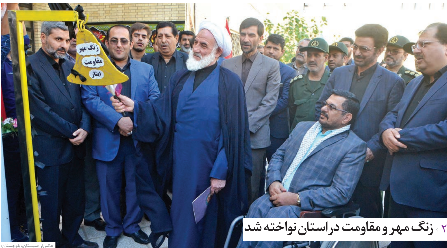
۲ زنگ مهر و مقاومت در استان نواخته شد