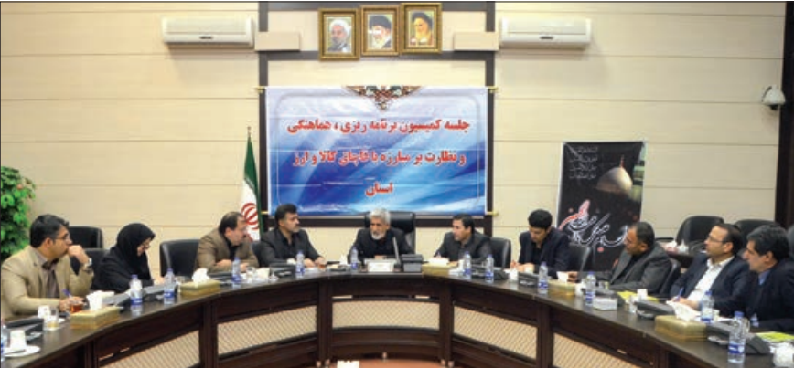
رئیس سازمان جهاد کشاورزی، پیشنهاد اختصاص ارز دولتی به وارد کنندگان دام و تشویق آن ها برای واردات داده شد

دومین دور توزیع سبد کالا، ویژه مددجویان نهادهای حمایتی همزمان با دیگر نقاط کشور در استان آغاز شد. مدیرکل تعاون، کار و رفاه اجتماعی به خبرنگار ما گفت: در این مرحله ۱۲۰ هزار و ۲۰۰ خانوار تحت پوشش نهادهای حمایتی مشمول دریافت