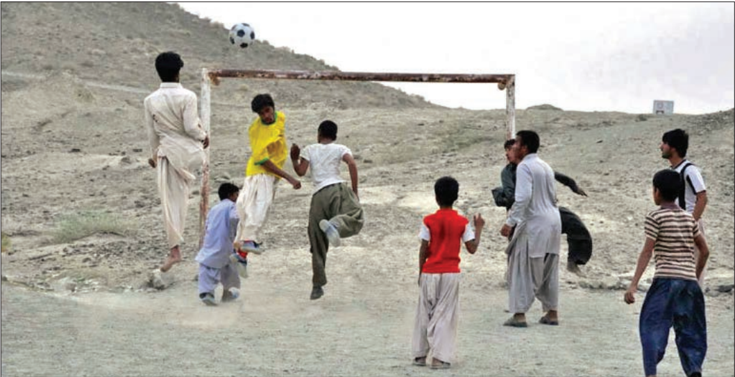
دهواری، سرانه ورزش سب و سوران همچنان صفر است

به گفته رئیس اداره ورزش و جوانان سب و سوران، آمار ورزشکاران سازمان یافته این منطقه در سال گذشته به بیش از هفت هزار نفر رسید اما این آمار فقط مربوط به افرادی بود که برای بیمه خود اقدام کردند، تعداد بسیاری به دلیل شرایط مالی نامناسب و ناتوانی در پرداخت حق بیمه اقدام نکردند، در حالی که این اقدام می توانست آمار واقعی ورزشکاران شهرستان را نشان دهد. وی می افزاید: با توجه به یک ساله شدن اعتبار بیمه ورزشی باید گفت امسال آمار ورزشکاران چندان تغییر نخواهد کرد اما این فقط درباره افراد بیمه شده است و بسیاری از جوانان و روستاییان بدون بیمه ورزشی فعالیت می کنند، اما با این وجود وضعیت بیمه شده های امسال نسبت به سال قبل بهتر ارزیابی