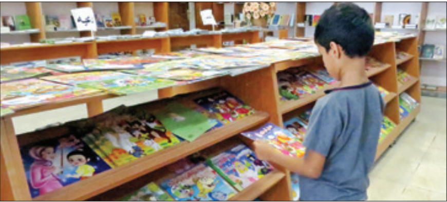
نویسنده کودک؛ لازم است ارزش قلم نویسندگان کودک دیده شود. کودکان همچون لوح سفید هستند و کار برای آن ها حساس است

کودک قرآنی فعالیت دارم، به همین دلیل مطالعات زیادی از احادیث و داستان های قرآنی دارم تا آن چه به نگارش در می آورم درست باشد و اثر خوبی روی کودک بگذارد.