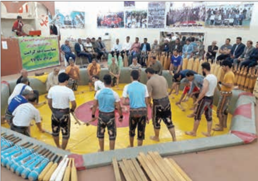
کلانتر، پهلوانان سیستانی با منش پهلوانی خود هنوز چراغ زورخانه سیستان را روشن نگه داشته‌اند

وی می‌افزاید: در صورت فراهم شدن مکان مناسب