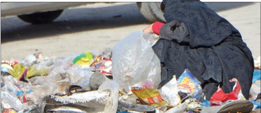
کارشناس ارشد روان شناسی بالینی؛ وقتی مادر دچار اعتیاد باشد در آینده ای نه چندان دور فرزند او هم چنین مشکلی پیدا می کند

کرم و فرزندم مرد. اما فرزند دیگرم به دنیا آمد. او هم به مواد مخدر وابسته است. گاهی آن قدر خمار می شوم که نمی دانم پسرم کجاست، چه می خورد و چه می پوشد.