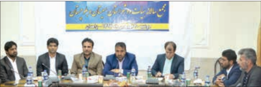
معاون اداره کل ورزش و جوانان، ووشو یکی از هیئت های برتر استان در توسعه ورزش همگانی و قهرمانی در دو قسمت بانوان و آقایان است

معاون امور ورزشی اداره کل ورزش و جوانان هم گفت: ووشو یکی از هیئت های برتر استان در توسعه ورزش همگانی و قهرمانی در دو قسمت بانوان و آقایان است، این رشته فعالیتش را از صفر شروع کرد و با هدف گذاری و اقدام های انجام شده طی سال های اخیر توانست قهرمانان آسیایی و داوران بین المللی پرورش دهد و بازیکنانی را به اردوهای تیم ملی معرفی کند. «ادم کرد» ادامه داد: ووشو یکی از هیئت هایی است که بیشترین فعالیت را داشته و بیشترین برنامه ها را در سال گذشته برگزار کرده و مدال های زیادی به ارمغان آورده است که امیدواریم امسال هم این رشته بتواند خوش بدرخشد و مقام های ارزنده ای در کشور کسب کند. وی با اشاره به افزایش ورزشکاران بیمه شده استان اظهار کرد: تعداد ورزشکاران سازمان یافته استان از ۳۹ هزار نفر در سال ۹۵ به ۴۶ هزار نفر رسیده است.