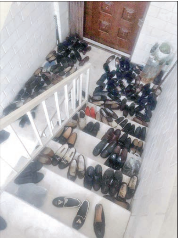
بلند صحبت کردن در راه پله ها، نظافت ساختمان و ... عواملی است که سبب آزار همسایه می شود

آکنه که مردم آن را با عنوان جوش های ناشی از غرور جوانی می شناسند یکی از شایع ترین بیماری های پوستی و یکی از بیشترین دلایل مراجعه بیماران به پزشکان متخصص پوست است. آکنه در منافذ بسته شده غدد چربی شامل صورت، گردن، سینه، پشت، شانه ها و حتی بازوها بروز می کند. آکنه دلایل مختلفی دارد، به دلیل تغییرات هورمونی اتفاق افتاده در بدن همه معتقد هستند این عارضه از سن بلوغ ایجاد می شود. چون غدد چربی که در پوست است بعد از رسیدن فرد به سن بلوغ فعال می شودو در بروز آکنه غدد چربی مهم است. با این حال این بیماری به گروه سنی خاصی محدود نمی شود و بزرگسالان حتی در ۴۰ سالگی هم به آن مبتلا می شوند. آکنه بیماری و خیمی نیست، اما می تواند سبب بد شکل شدن صورت و در نتیجه ناراحتی روحی بیمار شود. دلیل این که آکنه در برخی افراد از سن بلوغ به بعد ایجاد می شود گاهی تغییرات هورمونی به ویژه در بدن خانم هاست به عنوان مثال کیست های تخمدانی و هورمون های مردانه هم گاهی سبب بروز آکنه در بدن می شود. بهداشت پوست، رژیم غذایی، نور خورشید، فرآورده های آرایشی در تشدید آکنه موثر است. آگاه کردن پزشک از نوع مواد آرایشی که مصرف می کنید می تواند در انتخاب روش صحیح درمان موثر باشد. جز درمان اختصاصی که پزشک برای شما تجویز می کند، باید مراقبت از پوست را تا زمانی که دوره آکنه تمام نشده است ادامه داد. آنتی بیوتیک هایی هم است که به صورت موضعی استفاده می شود که از آن برای درمان مواردی از آکنه که حد نیست استفاده می شود. البته در زمان مصرف آنتی بیوتیک های خوراکی، بعضی زنان دچار عفونت های قارچی دستگاه تناسلی می شوند.