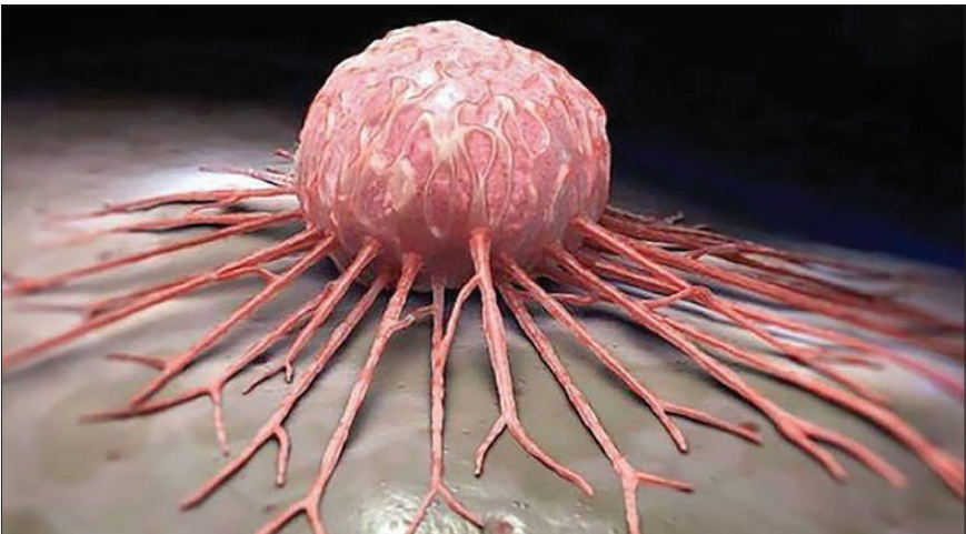
معاون دانشگاه علوم پزشکی زاهدان: در استان بر اساس آمار سال ۹۳ سرطان های پستان در زنان و معده در مردان بیشترین شیوع را دارد