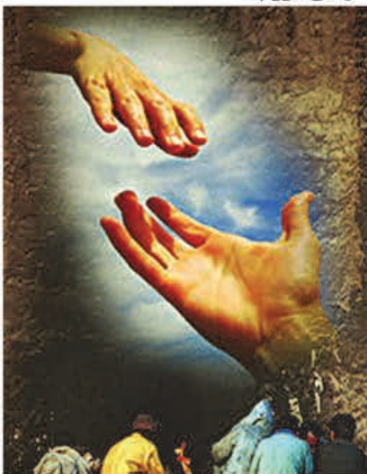
زاهدان - شریفی - گزارش ویژه

لازم به ذکر است از سازمان بهزیستی و ستاد مبارزه با مواد مخدر استان که ما را در این راستا مورد حمایت خود قرار داده اند تقدیر و تشکر بعمل می آورم.