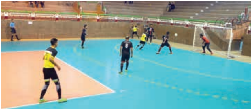
رقابت پر هیجان ماهان و لوازم ورزشی زاهدان در دور رفت فینال لیگ فوتسال

بانک توسعه تعاون زاهدان، شهرداری کنارک، جنوب ایرانشهر، تعویض روغنی سام زابل و خاش در گروه الف و تیم های تندر نیکشهر، وحدت زاهدان، آریا بخشان سراوان، بخشداری سرباز، شهرداری چابهار، دهیاری سزه ایرانشهر و ساحل هیرمند زابل در گروه ب این