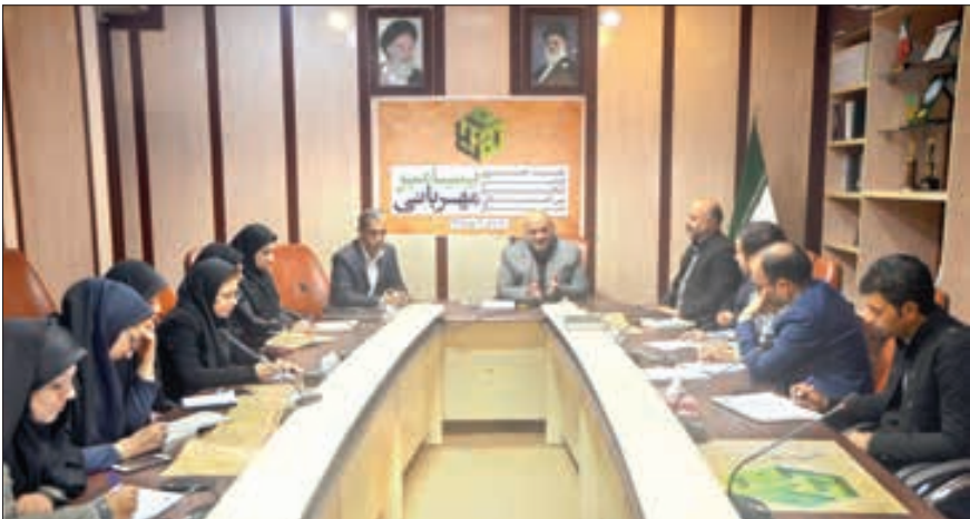
دومین کنگره بین المللی شعر «پیامبر مهربانی» ۱۳ دی در تالار فرهنگی سینمایی هلال احمر افتتاح می‌شود

این که اطلاع‌رسانی در حد وسیع به همه استان‌ها انجام شده است گفت: سال گذشته حدود ۶۰۰ اثر به دبیرخانه ارسال شد و امسال تعداد آثار به دو برابر رسیده است که هنوز هم در حال افزایش است. وی اظهار کرد: برخی از آثار ارسالی از کشورهایی مانند افغانستان، پاکستان، عراق، ترکیه، ترکمنستان و آذربایجان است که شاعران آن سمبلیک و معروف نیستند بلکه آثار خود را به جشنواره ارسال کردند و کارشان پس از داوری برگزیده شد. وی