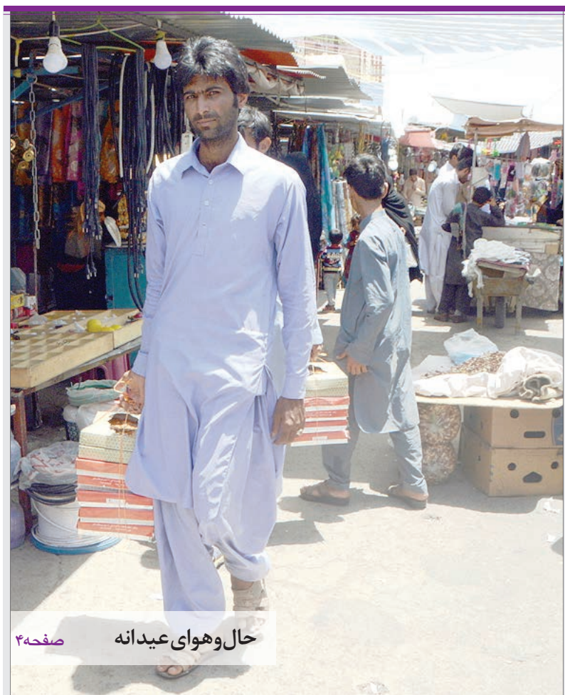
صفحه ۴ حال و هوای عیدانه