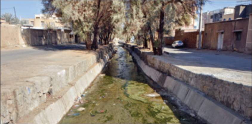
یک شهروند: یک قسمت از مسیل دیوار کشی نشده و حتی برای تردد عابران پیاده پل تعبیه نشده است

یکی از کاسب های محله هم به خبرنگار ما می گوید: زمانی که ماموران شهرداری به منظور احداث دیوار برای دو طرف مسیل آمدند تاکید کردیم که ابتدا زباله