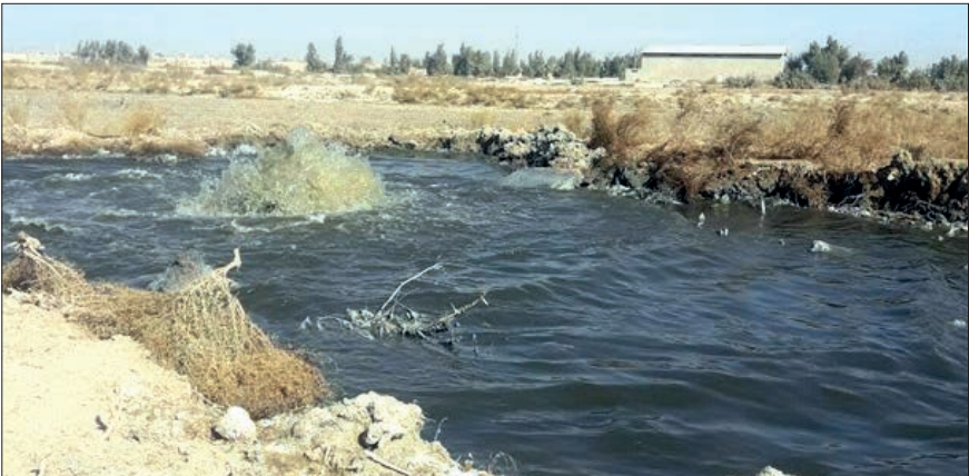
رئیس مرکز تحقیقات و آموزش کشاورزی و منابع طبیعی، باز چرخانی پساب روش خوبی برای برون رفت از شرایط فعلی منطقه و احیای کشاورزی است

افضا می کند: برای داشتن یک برنامه مدون و زیر پوشش بردن اراضی کشاورزی بیشتر باید دستگاه های متولی با برنامه ریزی درست اقدامات لازم را انجام دهند، بر اساس تصمیم های گذشته، در مرحله نخست استفاده از پساب های خانگی تصفیه شده برای کمر بند فضای سبز زابل مورد نظر است و شهرداری مکلف به لوله کشی آب تصفیه شده از پساب های خانگی برای فضای سبز شهر شد اما اقدامی انجام نشده است. وی تصریح می کند: ۸۰ درصد فاضلاب خانگی زابل نوسازی شده و ۲۰ درصد آن به دلیل کمبود اعتبار هنوز اجرایی نشده است، روزانه ۱۱ هزار متر مکعب از پساب خانگی به سمت تصفیه خانه هدایت می شود که البته ۳۵ درصد آن قبل از رسیدن به تصفیه خانه هدر می رود. به گفته وی، قرار بود این مقدار آب تصفیه شده برای طرح کمر بند سبز زابل استفاده شود که به دلیل فراهم نشدن زیر ساخت ها این اقدام انجام نشد و آب تصفیه شده در اختیار تعدادی از کشاورزان اطراف تصفیه خانه قرار می گیرد. وی می گوید: یکی از مشکلات در فاضلاب و پساب های خانگی، توسعه حاشیه نشینی و گسترش آن است که به دلیل نداشتن فاضلاب مجبور به تخلیه آن در حوزه های اطراف هستند و قسمتی از پساب به این طریق هدر می رود. با توجه به هزینه های بالای جمع آوری، انتقال و تصفیه پساب ها، نیاز است مسئولان امر و سرمایه گذاران در این باره همکاری کنند. سرابندی اظهار می کند: در صورت تکمیل کامل شبکه فاضلاب زابل می