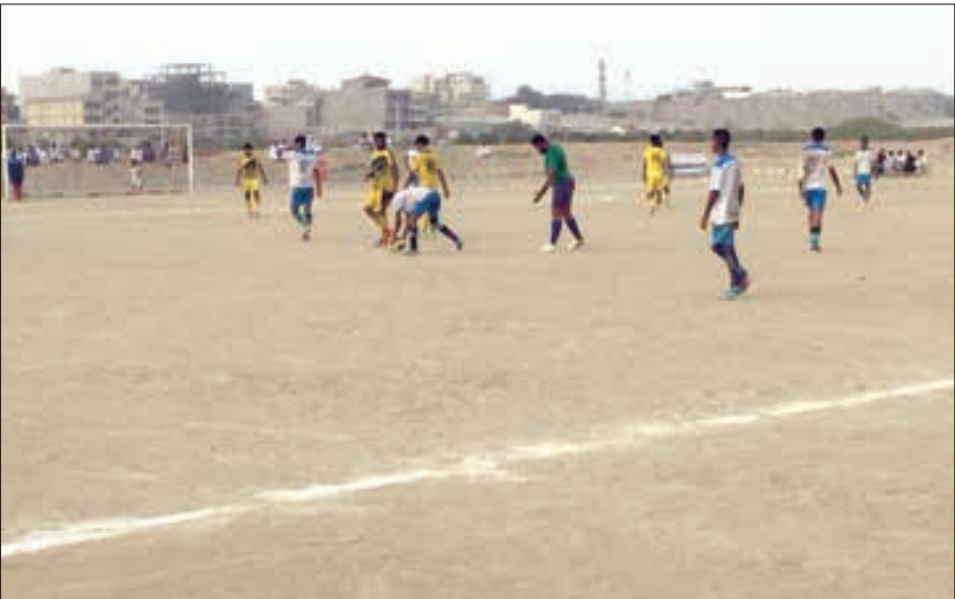
در این تورنمنت تیم ها در ۱۵ دیدار رقابت کردند که در پایان دو تیم خلیج فارس چابهار و هلال احمر نیکشهر به مرحله فینال رسیدند

یکی دیگر از تماشاچیان می گوید: در این رقابت ها تیم هایی