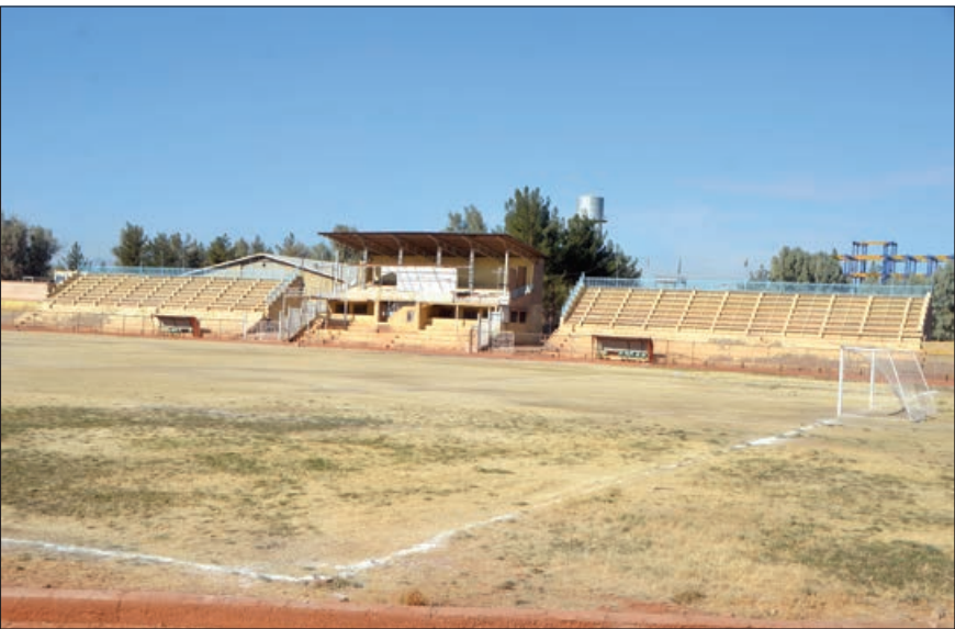
در اجرای طرح نوسازی و به‌سازی مجموعه ورزشی ۱۷ شهریور شش سالن ورزشی تخریب شد که خود سبب کاهش سرانه ورزشی زاهدان شد

وی می‌افزاید: در حوزه فضاهای ورزشی برای زاهدان برنامه ریزی مناسبی انجام نشده است و در منطقه زیباشهر به جز سالن ورزشی ارتش سالن دیگری وجود ندارد، ساکنان مهرشهر نیز هنوز سالن ورزشی ندارند،