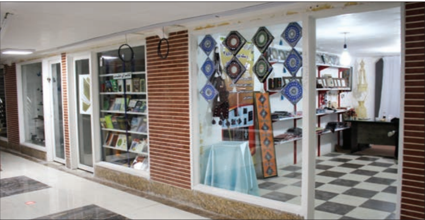
یک شهروند: برای معرفی مکان به خوبی تبلیغ نشده است و بسیاری از مردم از آن اطلاع ندارند

اطلاعی ندارند فروش کمتر است. وی ادامه می دهد: برای معرفی این مکان در نمایشگاه های برگزار شده در زاهدان اقدام به تبلیغ می کنیم و به بازدیدکنندگان تراکت می دهیم و آن ها هم تا چند روز پس از نمایشگاه از فروشگاه های ما بازدید و خرید می کنند. البته در چند ماه اخیر نسبت به قبل، فروش بهتر شده است و به دلیل این که هزینه چندانی برای غرفه ها پرداخت نمی کنیم می توانیم به فروش امیدوار باشیم. پیش از این در خانه کار می کردم و مشتریان به آن جا رفت و آمد داشتند که چندان مناسب نبود، اما در این بازارچه کارگاه دارم و مشتریان هم به این مکان مراجعه می کنند. این صنعت گر که به گفته او در کارگاهش ۱۰ نفر کار می کنند ادامه می دهد: تولید کنندگان صنایع دستی زیر مجموعه اداره کل میراث فرهنگی، صنایع دستی و گردشگری هستند، اما چند وقتی است که مسئولان این اداره کل از این مکان بازدیدی نداشتند و از مشکلات ما خبر ندارند. در حالی که حضور آن ها به ما دلگرمی بیشتری می دهد و به ادامه کار امیدوار می شویم. اگر چه تعداد کسانی که برای بازدید به این زیرزمین مراجعه می کنند نسبت به ماه های اول افتتاح آن بیشتر شده است اما هنوز فاصله طولانی با شرایط مطلوب دارد. وی اظهار می کند: برای معرفی بیشتر این مکان تصمیم گرفتیم با همکاری تولید کنندگانی که فعالیت دارن اقدام به تبلیغ و معرفی کنیم. همچنین تلاش می کنیم نمایشگاهی در محل دایر شود تا شهروندان شناخت بیشتری نسبت به آن پیدا کنند.