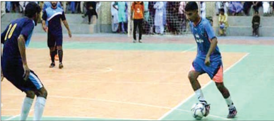
رقابت ۱۵۹ ورزشکار در مسابقات فوتسال جام رمضان هیرمند

خودنمایی می کند اما برنامه ریزی شده است تا در طول برگزاری رقابت های جام رمضان به دلیل نبود مکان ورزشی مسابقه ای لغو نشود که با انجام برنامه ریزی های لازم این مهم محقق شد و در طول ماه مبارک همه رقابت های ورزشی جام رمضان برگزار می شود و طبق این برنامه پس از رقابت های فوتسال جام رمضان در همان سالن والیبال لیست ها به رقابت می پردازند.