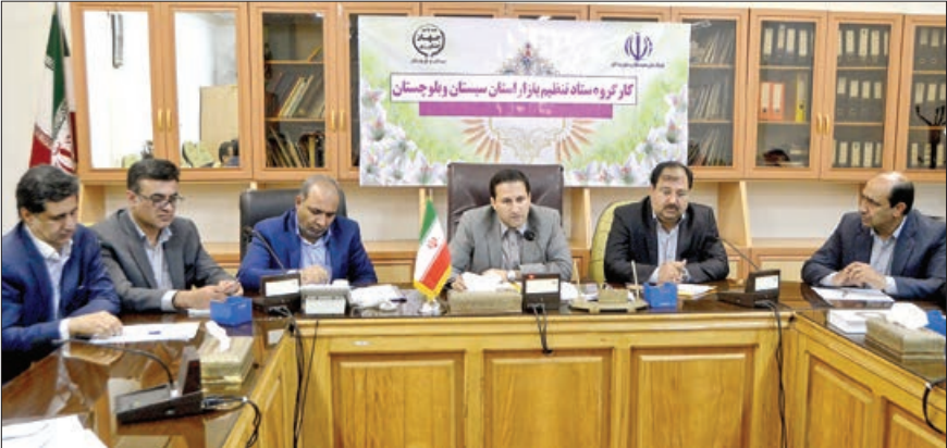
کالوندی: عده ای برای بالا بردن قیمت اجناس در استان اقدام به ذخیره اقلامی چون برنج در انبار های خود کرده اند

مدیر کل امور اقتصادی استانداری گفت: قسمت عمده ای از برنج استان از پاکستان تهیه می شود و به دلیل نوسانات ارزی کالاهایی چون برنج پاکستانی و برنج هندی که وابستگی شدیدی به نرخ ارز و رویبه داشت با افزایش ۴۰ تا ۵۰ درصدی رو به رو شد که شرایط سختی را برای مردم ایجاد کرد اما مصوب شد تا سهمیه ای که از طریق شرکت بازرگانی دولتی به میزان ۳۰ هزار تن به استان تعلق گرفته است با قیمت مصوب