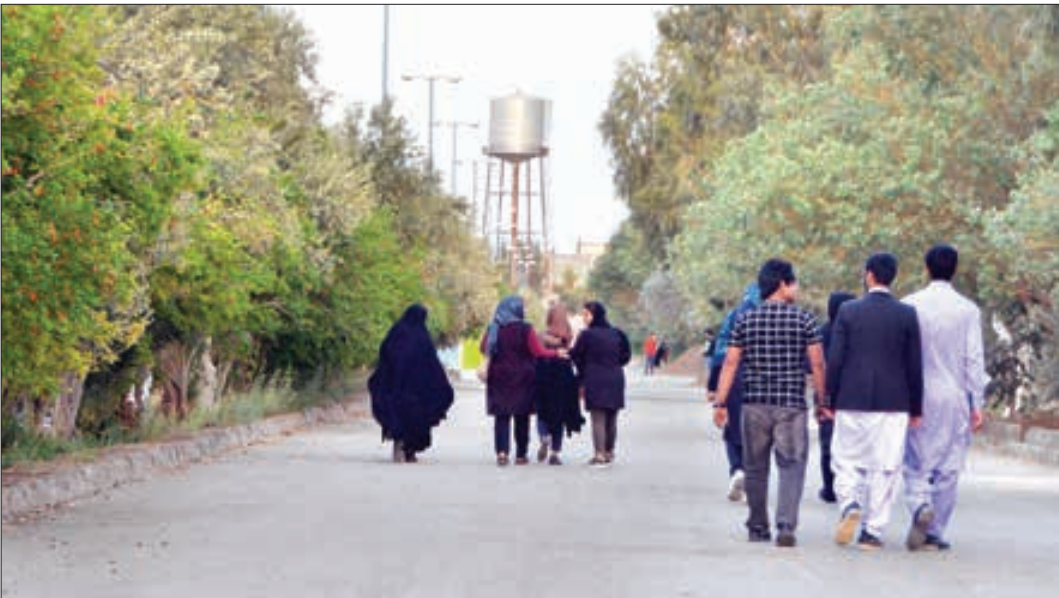
یک جوان: استان مراکز تفریحی و سرگرمی برای تخلیه هیجان دوران جوانی ندارد.

می دهد: مناره اختراع شده از فلز و کاشی ساخته و برای اولین بار در دنیا آینه کاری در مناره انجام شده است که نیاز به نگهداری ندارد. این مناره نیاز به داربست، مصالح ساختمانی و کارگر ندارد و سرعت ساخت آن بالاست. یکی از این مناره ها در تهران با ۱۱ هزار قطعه ساخته شده است و به دلیل این که مواد اصلی کار فلز است می توان هر طرح را روی آن اجرا کرد و همه کار با پیچ و مهره سر هم می شود. او اختراع دیگری را اولین کلاچ اتوماتیک غیر برقی می داند که چندین مقام از جمله برترین پژوهشگر و برترین اختراع ایران و ... را به دست آورد. این اختراع در تهران تجاری سازی شده و بیش از هزار خودرو از این سیستم استفاده می کنند.