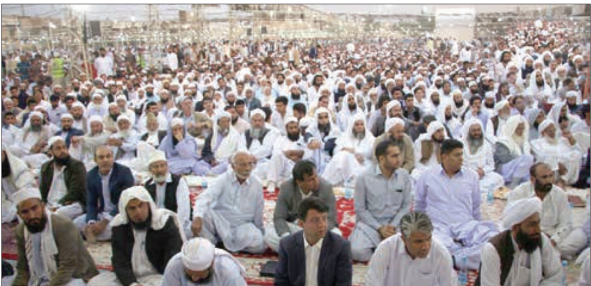
بیبست و همفتمین همایش دانش‌آموختگانی طلاب اهل سنت در زاهدان برگزار شد

و برادر نیستند و فقط انبیا در بالاترین معرفت قرار دارند و مخلوقات الهی را به سمت خالق راهنمایی و هدایت می کنند تا راه بندگی را به خوبی به جا آورند. مولوی «عبدالحمید اسماعیل زهی» افزود: راه رسیدن به پروردگار، پیمودن راه خشنودی او