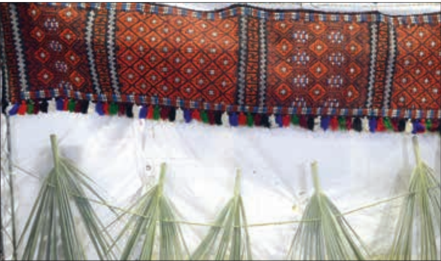
بافت گلیم ها نسبت به گذشته کاهش یافته است