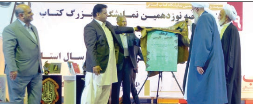
در آیین افتتاح نمایشگاه از کتاب «فرهنگ بلوچی– فارسی» رونمایی شد

از این رو پیگیری ها برای برگزاری نمایشگاه های کتاب در مقیاس کوچک تر برای زابل، چابهار و ایرانشهر در حال انجام است که امیدواریم خروجی نمایشگاه های کتاب معرفی آثار ارزشمند استان در سطح ملی و بین المللی باشد. وی با اشاره به این که حضور ناشران استانی در این دوره جایزه کتاب استان چشمگیر بوده است اضافه کرد: بیش از ۱۱۰ عنوان کتاب به دبیرخانه رسید و مورد داوری قرار گرفت.