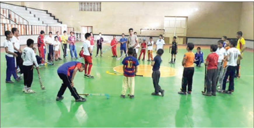
بیش از ۱۰۰ نفر علاقه مند به هاکی برای ثبت نام مراجعه کرده اند