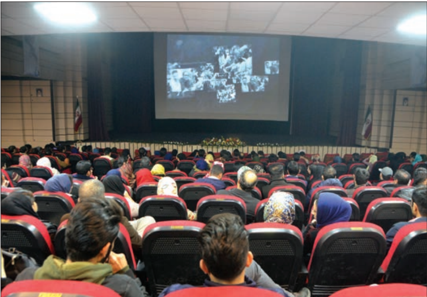
تفاوتی میان فیلم های اکران شده در زاهدان با استان های دیگر وجود ندارد