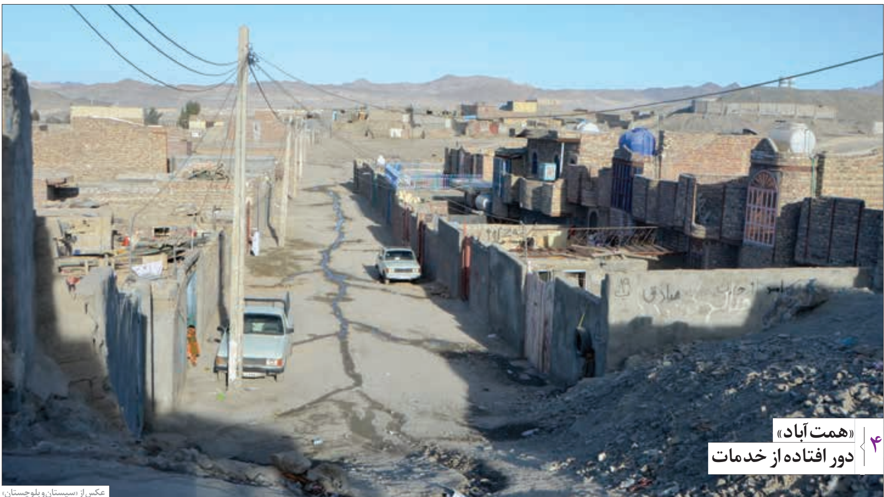
عکس از «سیستان و بلوچستان»