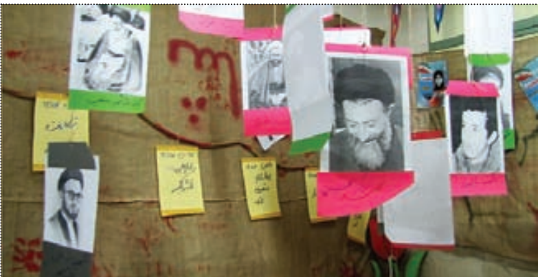
گروه خبر -نمایشگاه دستاوردهای انقلاب به مدارس انقلاب برپا شده است. به گزارش ایرنا دستیار دبیرکل اتحادیه انجمن های اسلامی دانش آموزان

حضور تیم ملی نونهالان کشتی فرنگی کشور در زابل